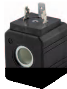
Tamaño 36 mm