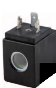
Tamaño 30 mm